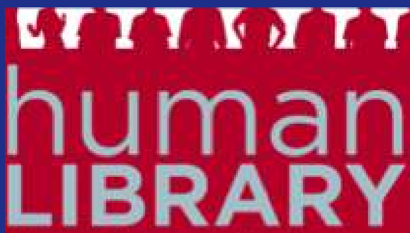
I LIBRI VIVENTI