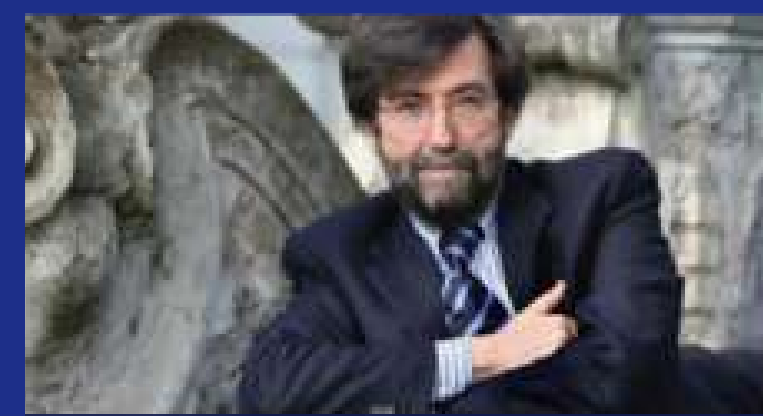
ERNESTO GALLI DELLA LOGGIA